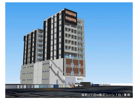
魚町3丁目M修正シーン7EL(東南)