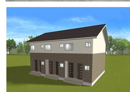
※イメージ画像の為実際とは異なります。