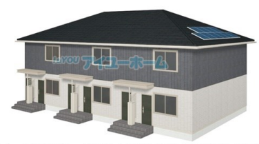
※イメージ図の為、実際とは異なる場合がございます アイユーホーム