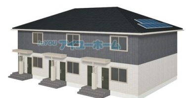
※イメージ図の為、実際とは異なる場合がございます アイユーホーム