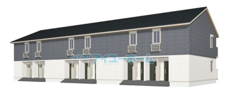
※イメージ図の為、実際とは異なる場合がございます。 アイユーホーム