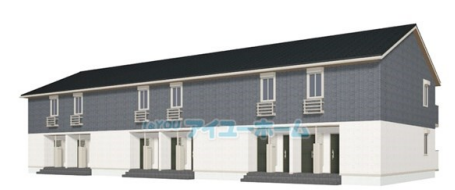
※イメージ図の為、実際とは異なる場合がございます。 アイユーホーム