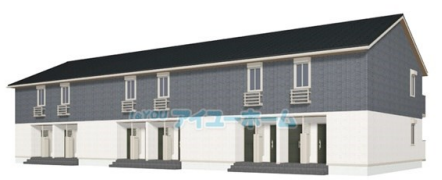
※イメージ図の為、実際とは異なる場合がございます。アイユーホーム