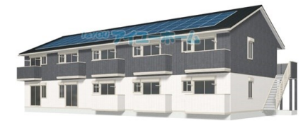
建築前のイメージ図の為、実際の外観とは異なる アイユーホーム