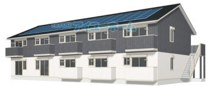
建築前のイメージ図の為、実際の外観とは異なる アイユーホーム