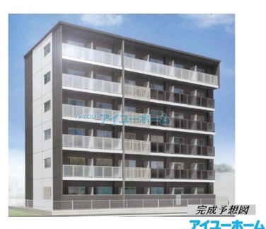
完成予想図 アイユーホーム