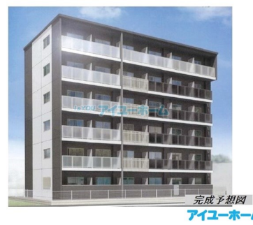
完成予想図 アイユーホーム