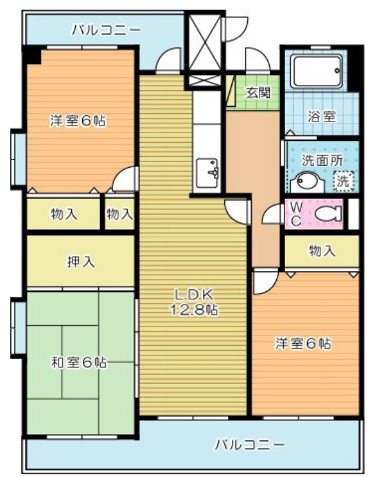
グレートハウス晚餐館