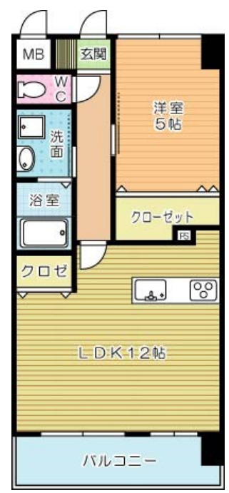
メディアプラカーサ