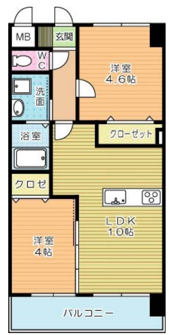
メディアプラカーサ