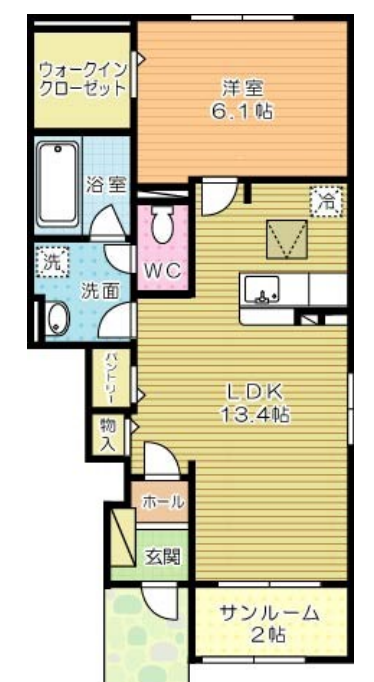
ヴィラルーチェ C棟