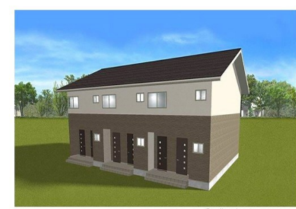
※イメージ画像の為実際とは異なります。