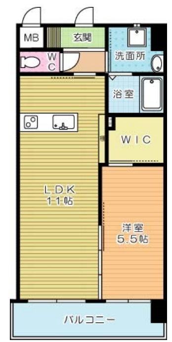
メディアプラカーサ