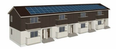
※イメージバースのため、実際とは異なる場合がございます。

小倉（福岡）駅 鹿児島本線 小倉（福岡）駅 バス59分 横沼入口 バス停徒歩3分