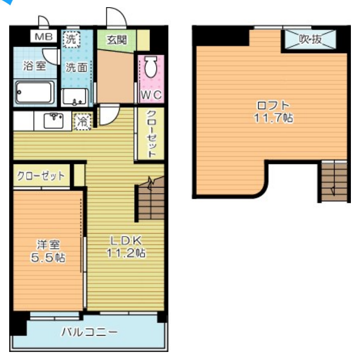
コンプレート富士見