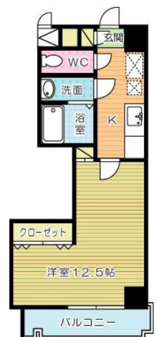
堺町センタービル