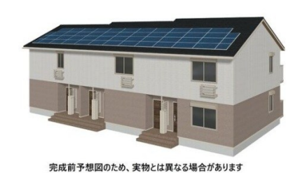
完成前予想図のため、実物とは異なる場合があります